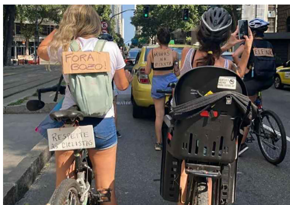
Figura 3 Cicloativismo no Rio de Janeiro, Brasil.

O ponto de encontro ocorre na Cinelândia, semanalmente, e são divulgados nas redes sociais pelo grupo. Já a decisão sobre as rotas semanais é composta pelas mulheres presentes no local.