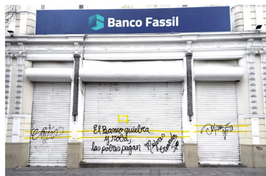
Figura 2 Denuncia a violência institucional em La Paz, Bolívia.

O ativismo do coletivo “Mujeres Creando” é internacionalmente reconhecido, já participou de exposições e bienais de arte.